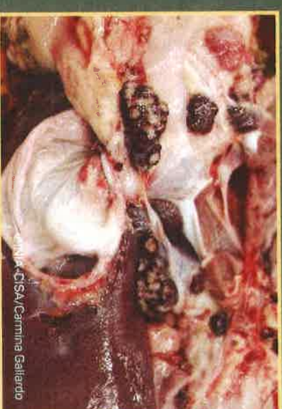
Krvavi limfni čvorovi