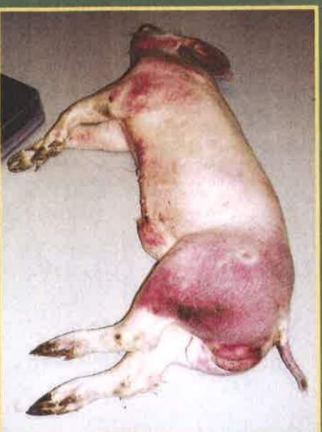
Krvavi proljev i crvenilo na koži vrata, grudi i nogu

ASK se manifestira različitim kliničkim znakovima. Zaražene, bolesne svinje uglavnom ugibaju. Obično se javlja gubitak apetita, težanje i nevoljkost, a svinje brzo i iznenada uginu. Rijetko se pojavljuju drugi klinički znakovi: potištenost, gubitak tjelesne težine, krvarenja na koži (vrhovi uški, rep, noge, grudna i trbušna regija), otežano kretanje i pobačaji kрмаča. Klinički znakovi se teže uočavaju u divljih svinja.