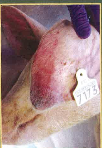
Cijanoza – plavo ljubičasta boja na vrhovima uški