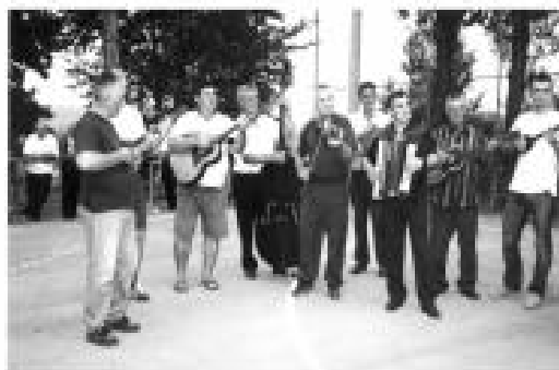
Viduševački tamburaši svojim svirkom uvijek su znali razgaliti dušu.

užurbani, nestrpljivi, brinu kako će ono što su pripremili zvučati na radiju. Slušam ih i gledam sjećajući se davnih godina kada sam i sama bila član KUD-a. Gdje smo sve bili? Jastrebarsko, Karlovac, Kladaša, Cazin, Crikvenica ... Sjećam se Smotre folkora u Slunju i izleta na Plitvice. Naravno, mi mladi obukli smo narodne nošnje, vrtjeli se s muzikom ili bez nje, a foto-aparati stranih turista koji su se tu našli samo su bljeskali. Šarena nošnja privlačila je znatiželjnike poput magneta gdje god smo se pojavili. Nošnje više nemam, s tim sam se pomirila. Nikad je neću prežaliti. Ali, da mi je danas samo jedna od tih fotografija i eto, ovog oblačnog popodneva u kome je napokon pala malo kiše na naš sušom izmučeni zavičaj, sa starim članovima nove Udruge vrtim film trideset godina unazad. Nekih, na žalost, više nema. Žive