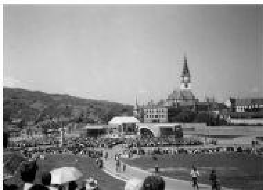
Panorama Marijnog sveštita u Mariji Bistrici