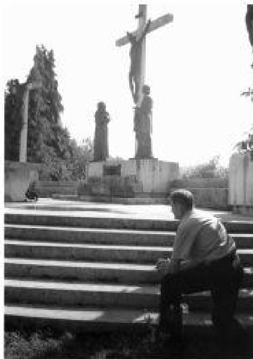
Pobožnost Križnog puta nezaslužni je dio bistričkog hodočašća.

63 župe. Nadahnuto pripovjeda vč. Stjepan Razum, tako je Sv. Misa na otvorenom, narod raspršen svuda dostojanstveno i s pažnjom sudjeluje. Gladni smo poruka ohrabrenja, utjehe i nade u sigurnije vrijeme.