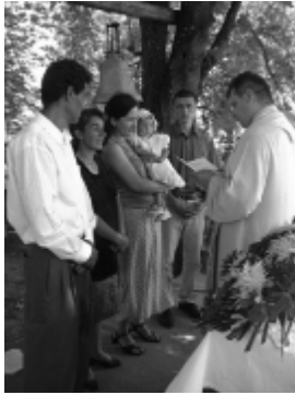
Samo su budućnosti svakog mjesta naroda