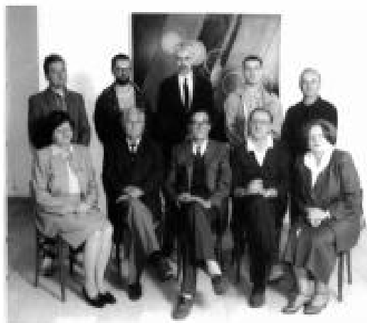
Predsjedništvo Učtu u Petrinji 1968. godine

bih već 1945. godine nastavio živjeti u Glini kamo su ondašnje komunističke vlasti * p o k a z n i * poslale mog oca na posao u tadašnju Poresku upravu. Godine 1959. vraćamo se u Petrinju gdje najprije završavam