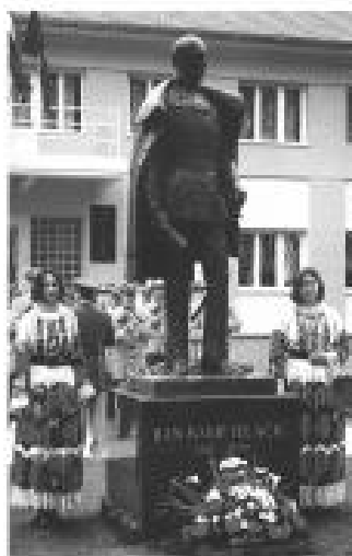
Spomenik banu Josipu Jelačiću podignut je 1997. godine

zvalo se štopno [stažemo] mjesto. Uz njega je bio jedan granični upravni časnik, koji je vodio upravu, a za sudbenost jedan satnik auditor, za šume jedan šumar, za građevine jedan građevinski satnik te jedan pobočnik za čisto vojničke svrhe.» Od 1842. g. do 1848. g. kao pukovnik u Glini službovao je kasniji ban Josip Jelačić (1801-1859). Njegovi su vojnici izgradili cestu između Gore i Petrinje koja je doprinosila i glinskoj prometnoj povezanosti, u Glini je dao urediti središnji gradski park, osnovao je podružnicu Hrvatsko-slavonskog gospodarskog društva koje je unapređivalo poljoprivredu, brinuo se za škole i stanje javnih zgrada, za uredene pristupe vodi radi napajanja stoke. Bio je sjajno obrazovan, ne samo u profesiji. Služio se sa šest jezika: «... govorio je hrvatski, njemački i francuski podjednako rječit, talijanski dosta dobro, mađarski i latinski nešto slabije, što mu je davalo prednost,