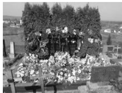
Koje li je zadovoljstvo premjestati ukrasne bukete po tuđim grobovima?