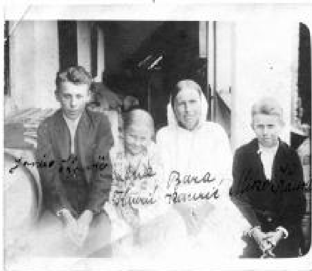
Obitelj Kaurić iz V.šaline spremna za odlazak u novi svijet - na posjedni je ovdje jedan biješnik da su to zasa ovi

viduševačke župe su uglavnom odlazili u Steelton u okolini Pittsburga, država Pennsylvanija, u kraj bogat rudnicima i teško m industrijom u razvoju i gdje su prvi naseljenici iz Europe stigli oko 1880. godine. Već pri stupanju na američko tlo čekali su ih različiti «mešetari» vrbujući ih za