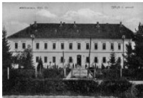
Popravilište početkom 20.st. našlo je mjesto na razglednici

Desno od Runjaninova spomenika skreće se u Ulicu kralja Tomislava, koja je nekad išla usporedno s gradskim zidom. Križanje Ulice Stjepana i Antuna Radića s Trgom dr. Franje Tuđmana i križanje Ulice kralja Tomislava s Vukovarskom ulicom, dozivaju u predodžbu postojanje tog obrambenog zida. Upravo se može osjetiti kako Ulica Stjepana i Antuna Radića nekad nije bila protočna. U stvari, postala je to tek onda kad je sagrađen željeznički kolodvor, da bi se gradski centar povezao sa željezničkom prugom.