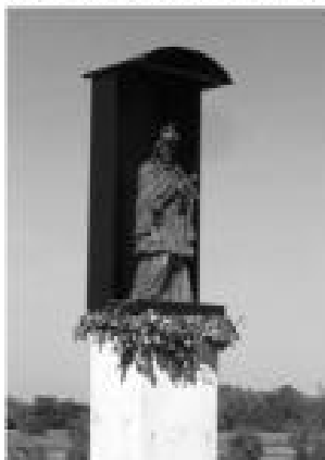
Kip Sv. Ivana Nepomuka na novom mostu preko rijeke Gline

Na blagdan zaštitnika glinske župe Sv. Ivana Nepomuka 16. svibnja 2003. godine svečano je pušten u promet novi most na rijeci Glini. Uz most je postavljen kip sveca poznatog kao zaštitnika ispuvne tajne i mostova. Nakon svečane Sv. Mise koju je predslavio pomoćni biskup zagrebački Vlado Košić, glavnim ulicama Gline prošla je veličanstvena procesija sve do mosta na izlazu iz grada prema Topuskom.