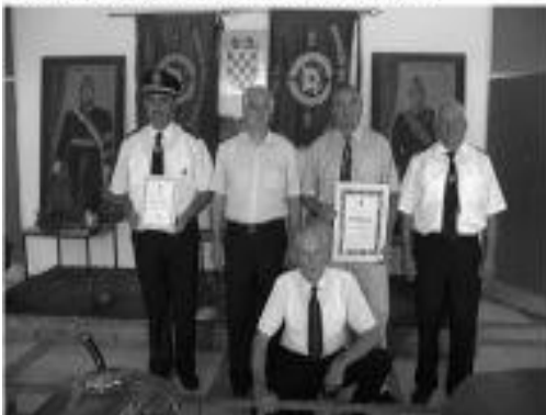
Ponosni vatrogasci na izložbi u Hrvatskom obrnu