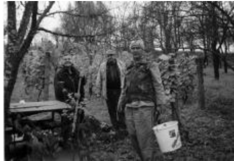
Petrinjcima je berba grožđa od starine do danas iznimno važan događaj