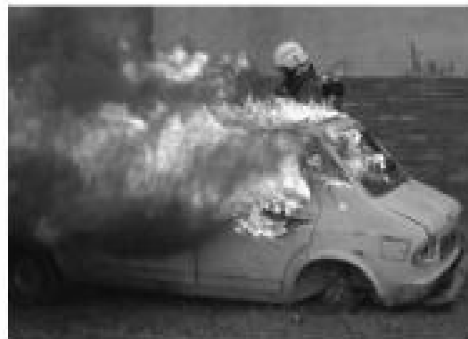
Atraktivna vježba glinskih vatrogasaca

Uz Dan domovinske zahvalnosti i Dan Grada, u Glini je organizirano niz sportskih susreta i natjecanja. Važno je spomenuti 3. međunarodnu atletsku utrku, dok je zabavan bio nogometni dvoboj mladih i debelih, ukajem su prvi nadmoćno pobijedili.