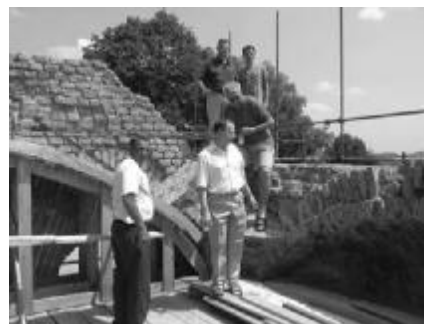
Majani na oštećenim "boltama" svoje crkve

Crkva sv. Ilije Proroka u Maji raketirana je 18. kolovoza 1991. godine iz dvaju aviona bivše JNA koji su poletjeli iz Bihaća. Njena obnova je započela ove godine sredstvima Ministarstva culture, Zagrebačke nadbiskupije, samih župljana te drugih dobrotvora. Izvodi se u dvije faze građevinska sanacija ratne štete u kojoj se vrijednost radova procjenjuje na 1 800 000,00 kn te unutarnje uređenje crkve. Obzirom da sredstava nema dovoljno, svaka je pomoć dobrodošla pa pozivamo sve sadašnje i bivše župljane, ove Župe, kao i sve one kojima je Maja u srcu, da doprinesu koliko mogu. Broj žiro računa kod "Nove banke" je: 2407000-1188010363. Svima od srca zahvaljujemo!