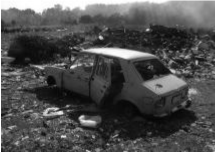
I ovo je, na žalost, slika iz našeg grada

Pošto spadam među rijetke stare Glinjane, slobodna sam nešto progovoriti o očuvanju našega gradskog nekadašnjeg trgovišta. Leži na 220 m nadmorske visine, katkada je dosta maglovit, a zrak je u njoj čist, jer nema takovih zagađenja na koje se mnogi građani drugih gradova tuže. Žao mi je samo da mnogi stanovnici ne vode o tome računa pa da malo više pažnje posvete čistoti i ljepoti svoga mjesta. Sramota je da pred mnogim napuštenim zgradama vlada takav nered koji dolazniku i prolazniku odmah uništi viziju o lijepom gradu. Da ne govorim o mladima koji u svojim noćnim pohodima razaraju i ono malo lijepoga što imamo. Nagrduju sve kuda prolaze, a da o tome ne brinu ni roditelji, ni grad ni policija. Zašto načelnik jednoga austrijskog grada kažnjava nekoga tko pljune na ulici, a mi ne smijemo čak ni opomenuti onoga tko èini nered u svojoj okolini? Tko to treba učiniti? Da li roditelji, škola ili gradska uprava? Željela bih da se svi slože pa da se provede akcija na čišćenju svih ulica, ne samo glavnih. Zar ne bi bilo ljepše saditi cvijeće i zelenilo gdje bi svi uživali u ljepoti okoliša, nego razbijati stakla i oluke na kućama? Tko će se za to pobrinuti ako ne mi sami? Zato apeliram na sve koji mogu nešto učiniti za naš okoliš i za, u budućnosti ljepši grad u kojem živimo. Ne treba za to novaca, nego volje i malo truda. Da se uvede samo simbolična kazna za bacanje raznog smeća, to bi već platilo i očistilo Glinu!