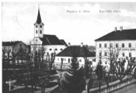
Park i okolnim građevinama u 19. st.

Prava i obveze graničara mijenjali su se tijekom vremena - npr. u jednom razdoblju članovi domaćinstva bili su dužni stražariti na granici, a u slučaju rata dati po vojnika. U kasnijim razdobljima po jednog vojnika davalo je 18 stanovnika graničnih područja, dok je u ostalim dijelovima Monarhije po vojnika davalo 140 stanovnika. Na, obveze se nisu iscrpljivale samo u vojnoj službi. Temeljno načelo ove vojne