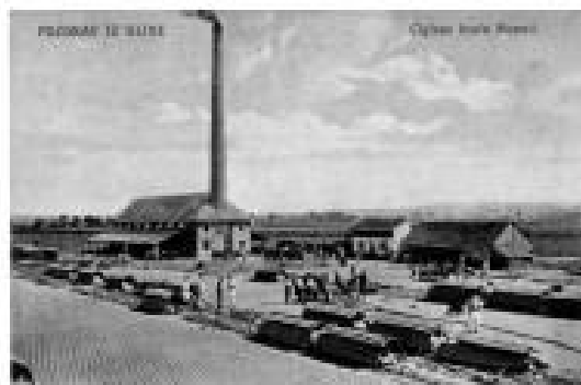
Glinška ogljana hrani je mnoge naraštaja danas je na tom mjestu pogon "Viveo"

Tuškanac 100, Demetrova 7 i 9, Ilirski trg 6. U Glini mu se pripisuje stambena kuća u Hrvatskoj ulici na broju 26. Prema opisima, crkva Sv. Ivana Nepomuka bila je jednostavna po vanjštni ali «vješta, majstorsko prostorno rješenje», akustična građevina s mirnomim baroknim oltarom, građevina koja je ostavljala «dojam jednostavne uzvišenosti i ljepote.» Naravno vrijedan bio je u njoj mirnomim oltar, prenesen iz zagrebačke katedrale. Nešto njegovih dijelova nađeno je «u raznesenoj šuti nakon oslobođenja Gline poslije domovinskog obrambenog rata.» Ta je crkva podrobno opisana u knjizi Mije Dukića «Glina i okolica», a prikazana je na poštanskoj marki izdanoj u prosincu 1995. u seriji «Hrvatski