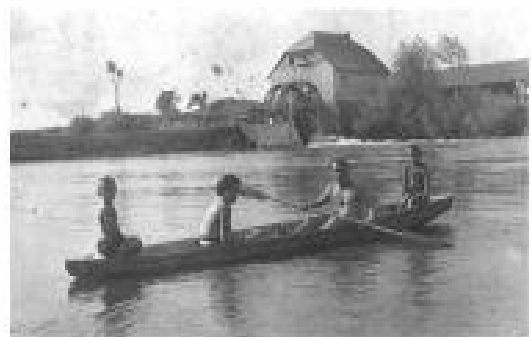
Parožev mlin - graden 1914/1915 omijeno kupalište Glinjano

Na rijeci Maji koja protječe ispod Majske ulice bilo je zgodno mjesto za kupanje. Tu su se kupala djeca i odrasli iz Majske ulice , od Ciglane i Klaonice . Kako su kuće bile blizu, stariji svijet je za letnjih žega dokazilo na kupanje pred noć ili u samu večer.