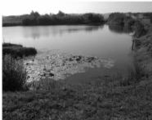
Glini bojer može biti oaza čistote i mira samo kada bi svi shvaćali njegovu vrijednost

Grad Glina je na obali rijeke Gline i na 112