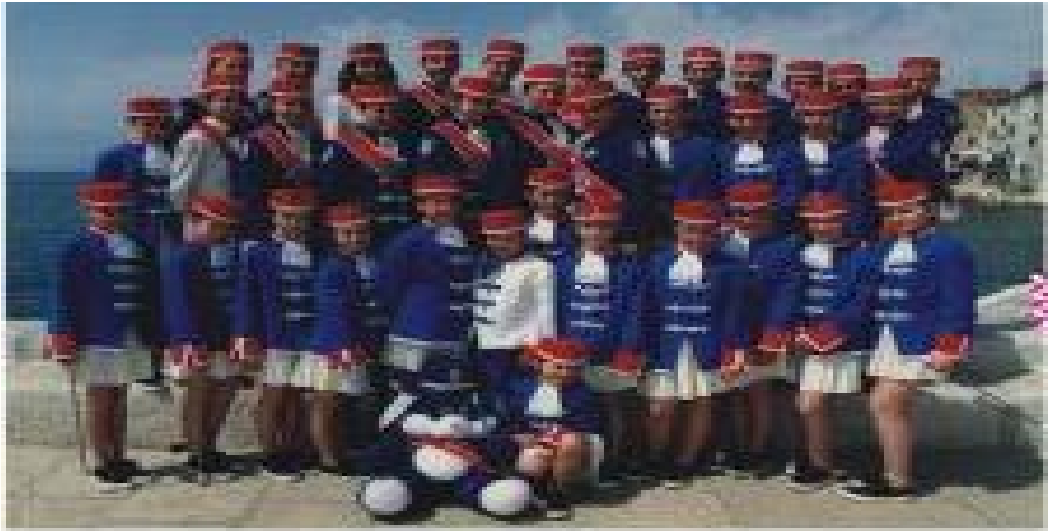
"GLINSKE BANICE" - SUBJONICE BELAYNOGO PRVENSTVA MALOSOCIETENIA BOVINI, 30. - 4. SEPTEMBRA 1993.