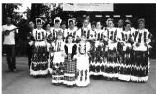
Uvijek spremne za pjesmu i ples - dio ženskog sastava KUD-a, Viduševac

Danas je tako malo događaja koji nas mogu istinski obradovati i razgaliti nam dušu. U općem pomanjkanju lijepih vijesti poput č uđa pronio se glas da je obnovljen rad nekadašnjeg KUD-a «Joso Marjanović» Viduševac, sada pod drugim nazivom i s većinom novih članova. Osnovani su ga 04. siječnja 2003. sami mještani-povratnici u selo i a n i koji 2 ive drugdje, a viduševački kraj im je u srcu. Predsjednik je Slavko Cmković, zamjenik Mato Kirin, a tajnica Slavica Kežman. Za sada okupljaju 40-tak članova u dobi od 8-65 godina. Vježbaju koliko im druge obveze dopuštaju, pjesme i plesove svaga zavičaja u prostorijama obnovljenog Vatrogasnog doma u Gornjem Viduševcu. Do sada su imali i dva službena nastupa: na Večeri folkora u Petrinji i na Smotri folkora u Martinskoj Vesl te dvije zabave fašničku i uskrsnu. Kako je materijalna baština u srpskom pustošenju hrvatskih sela između Gline i Kupe uništena, a malo je obitelji spasilo svoju narodnu nošnju, znanje naših majki i baka opet je došlo na svoje: kupuje se domaće laneno platno, išču «fete», ispisuju, našivaju zastori, rubače, švabice, štikaju špice itd. Prepoznatljive viduševačke «vesele» i «zgorele» rože na radost svih, zasjat će opet novim punim sjajem.