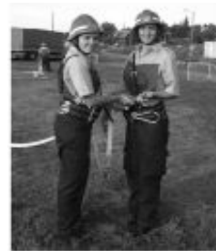
Ženska ekipa DVD-a "Buèica"

Obilježavanje 125. godišnjice osnutka i rada DVD-a Glina i blagdana Sv. Roka zaštitnika Novog Sela Glinskog