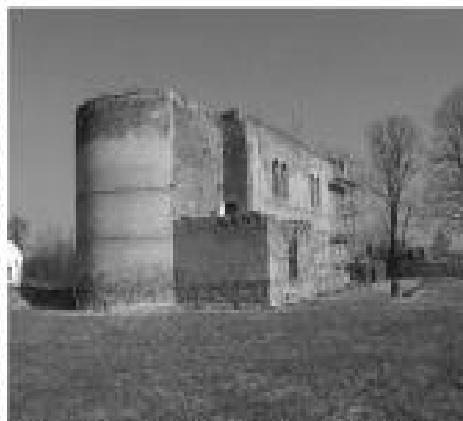
Crkva Sv. Djevice Potoka u Maji - danas je u obnovi

Ne zna se pouzdano je li majska (sračička) župa opstala u sve vrijeme turskih ratova,