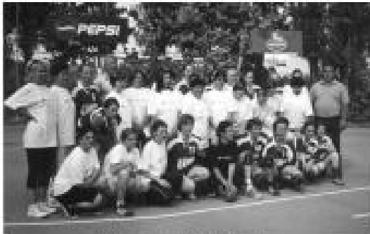
Ekipe veteranki RK "Mladost" i mladog sastava RK "Podravka-Vegeta"

Susret veteranki RK "Mladost" Viduševac i mlade ekipe RK "Podravka - Vegeta"